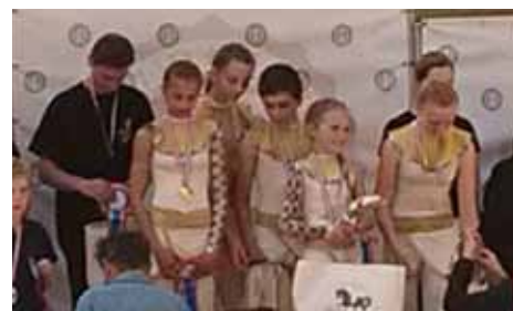
Epinal Voltige Am 4